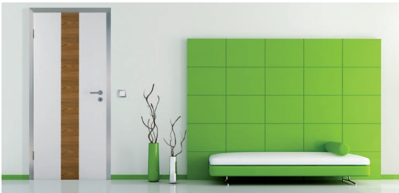
Fenster und Innentüren